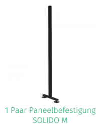
1 Paar Paneelbefestigung SOLIDO M