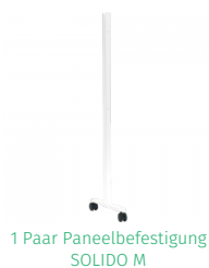
1 Paar Paneelbefestigung SOLIDO M