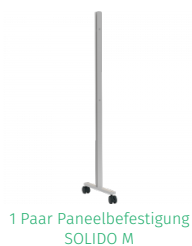
1 Paar Paneelbefestigung SOLIDO M