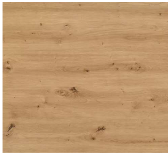
Wildeiche natur H1318 ST10

38 MM DICKE ARBEITSPLATTE MIT RUNDKANTE UND WIDERSTANDSFÄHIGER BESCHICHTUNG ZUR AUSSTATTUNG VON ARBEITSFLÄCHEN